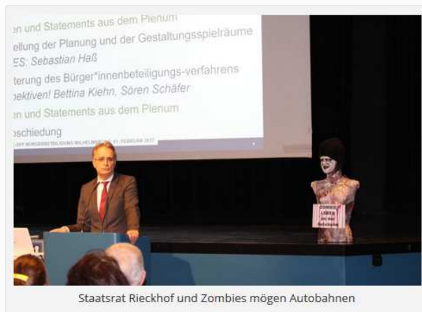
Staatsrat Rieckhof und Zombies mögen Autobahnen

Diese Herangehensweise macht deutlich, dass es Senat und Staatsrat nicht um wirkliche Mitbestimmung, sondern um politische Legitimation geht. Bereits die Ansetzung der Veranstaltung ist das Ergebnis mangelnder Bürger*innenbeteiligung. Die Stadt sah sich erst nach energischen Protesten und Besetzungen genötigt, überhaupt in Dialog mit ihren Bürger*innen zu treten. Entsprechend kontrovers gestaltete sich die Informationsveranstaltung im großen Saal des Wilhelmsburger Bürgerhauses.